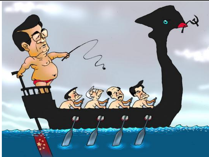
Con thuyền xã nghĩa (Babui-Danchimviet.info)